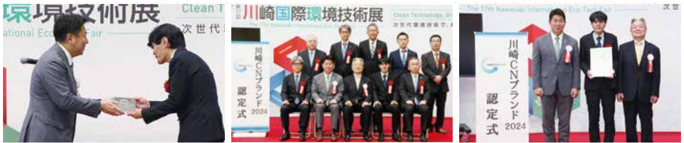
足立会長、川崎市長より認定証、楯がそれぞれ授与されました