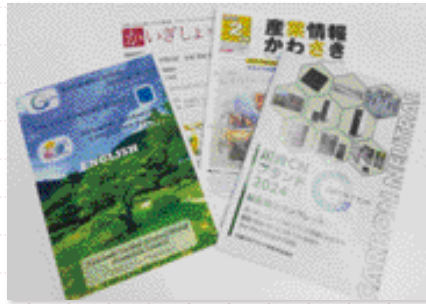
各種広報誌等に掲載