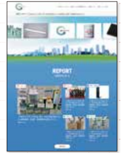
ホームページでの広報