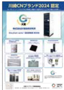
認定製品等のポスター作成