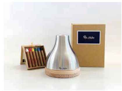
▲チョーク「キットパス」で花器表面に繰り返し描き消し可能