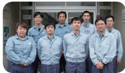
弊社開発メンバー

なお、川崎事業所には、市民の皆さんが分別したプラスチック製容器包装をアンモニアの原料とするプラント設備 (KPR) があります。私たちも、可燃ごみの分別に高い意識を持って取り組んでいます。